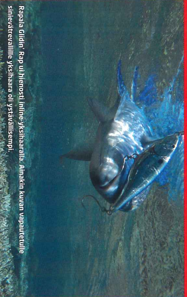
Rapala Glidin' Rap uihienosti inline-yksihaaralla. Ainakin kuvan vapauttelulle sinieväreväville yksihaara oli ystävällisempi.

Yksihaaran koukun suurimpia etuja on kuitenkin vieheen parempi uinti. Esimerkiksi melko vaatimattomasti uivat Rapala X-Rap SubWalk ja Glidin' Rap -jerkit saivat yksihaarakoukuilla aivan uuden elämän. Valitettavasti useimpiin perusjerkkeihin sopiva 4/0-koko jäi jostain syystä kokonaan pois tuotannosta. Onneksi 3/0 ja 5/0 käyvät suurimpaan osaan.