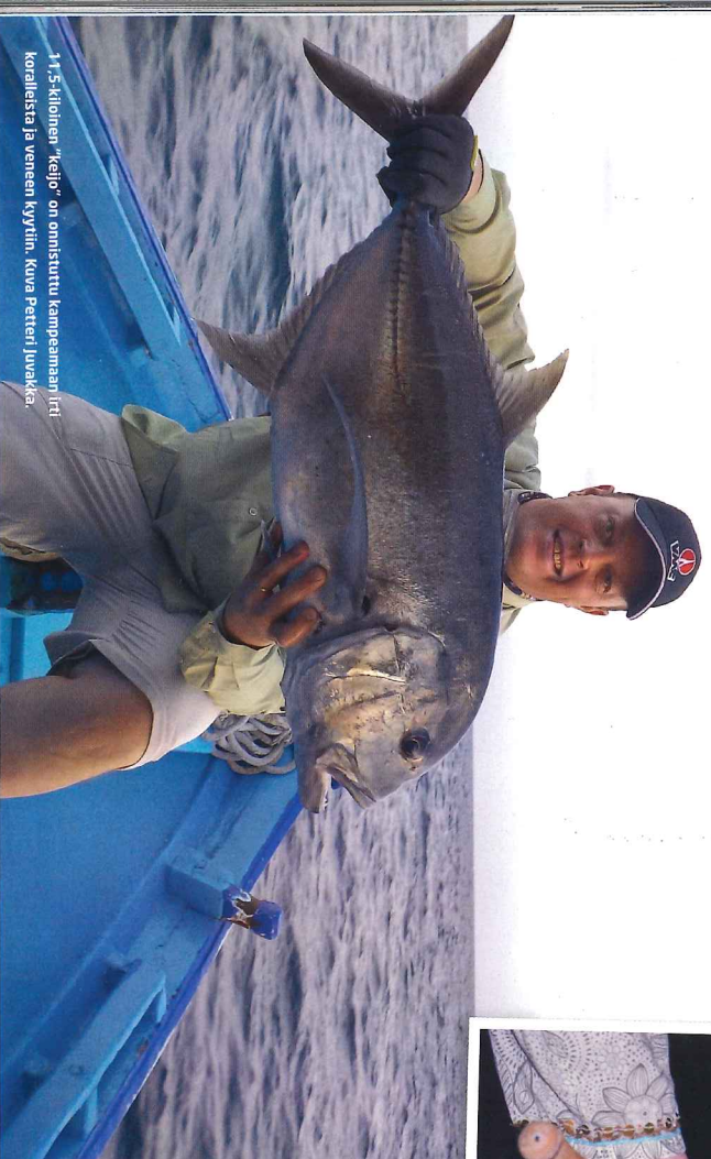
11,5-kiloisen "keijo" on omistettu kampeamaan tri kalleista ja veneen kyytiin.